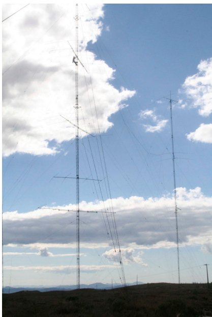
Trabalho na torre em ZX5J

Nosso membro e amigo Carl AI6V e XYL Sue AI6YL, logo após faturar o CQ WPX CW de 2008 em SOSB 15m (resultados no próximo número).